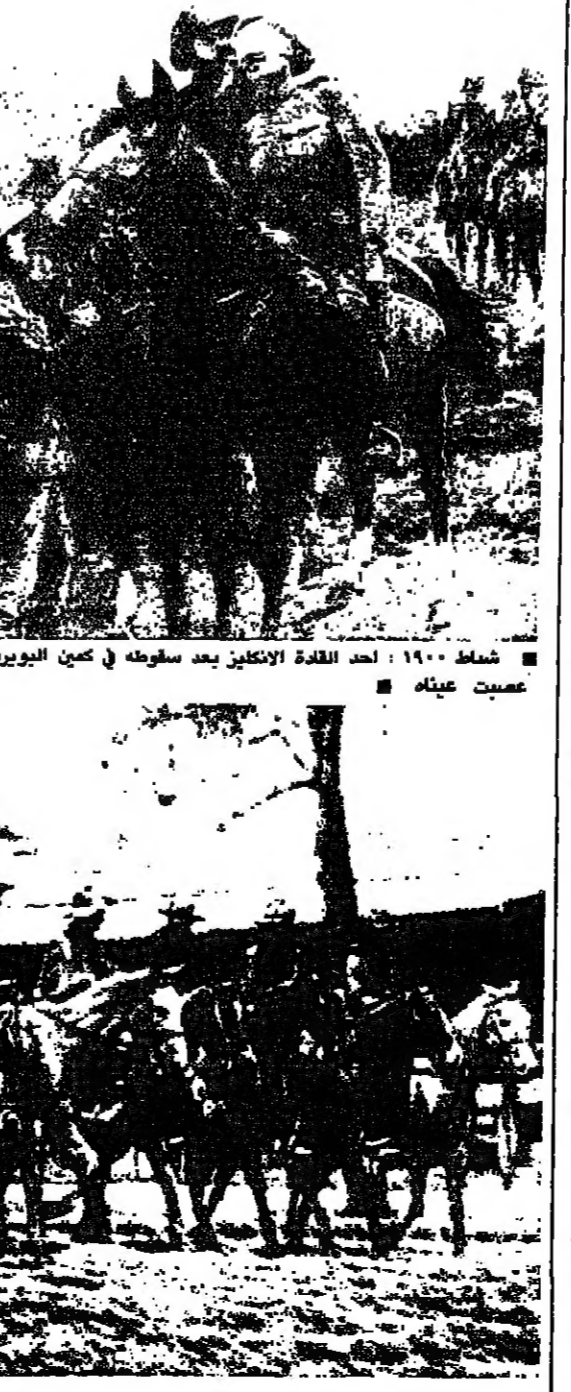
متروا الريفيقا الجنوبية بعد اعتقالهم عام ١٩١٥ على يد الانكليز